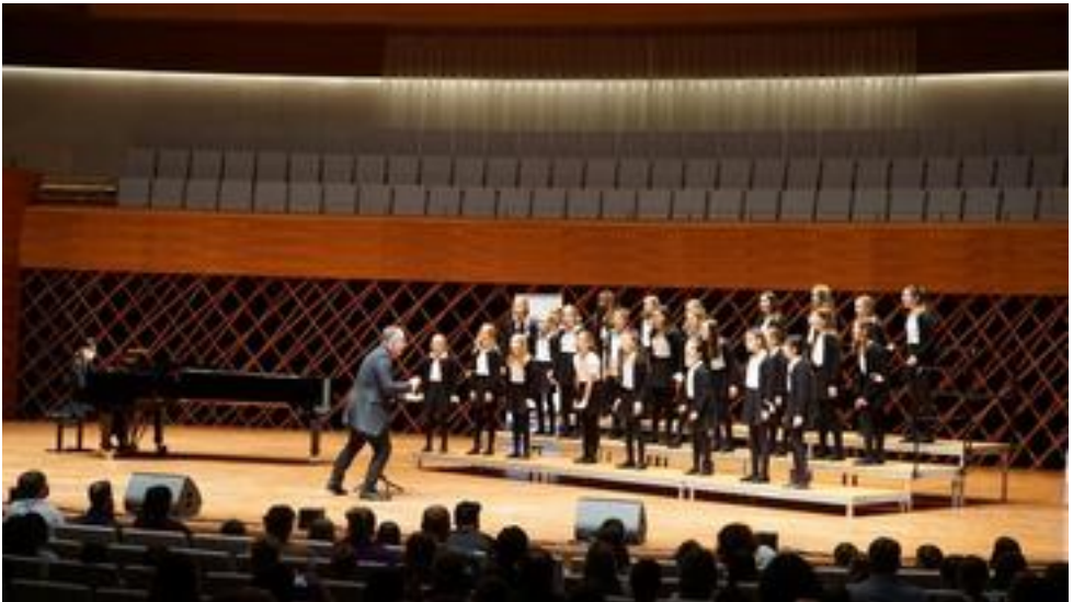
Konzertchor 1 der Akademie für Gesang NRW, Dortmund, 28 Mitwirkende