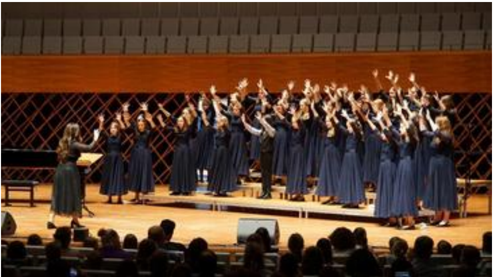
Konzertchor 2 der Akademie für Gesang NRW, Dortmund, 34 Mitwirkende