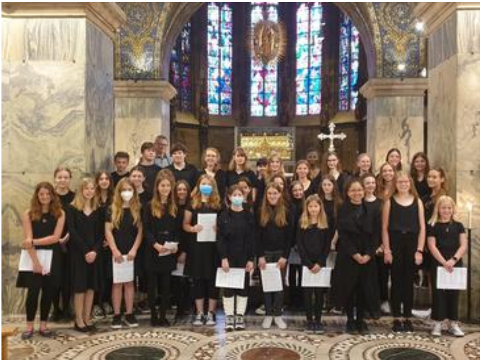
Kammerchor St. Ursula, Geilenkirchen, 38 Mitwirkende