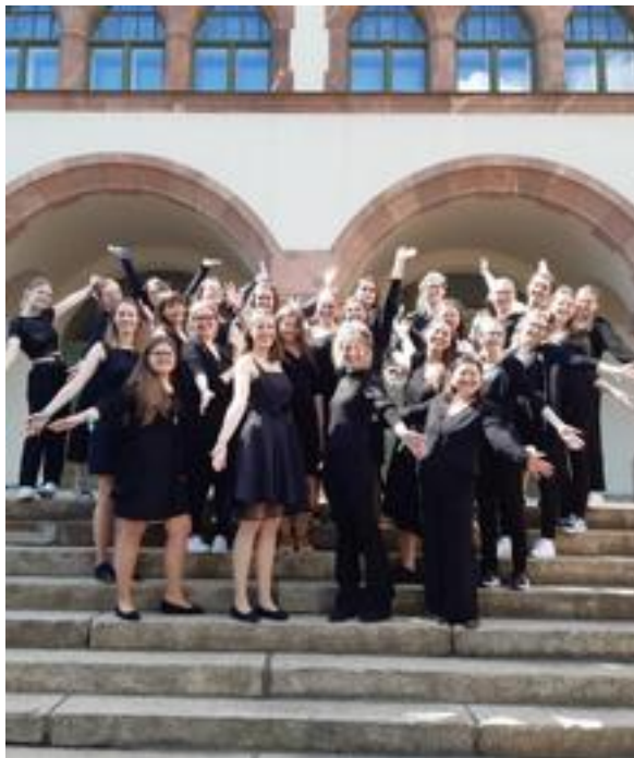
Konzertchor CANTABELLA Erwitte, 26 Mitwirkende