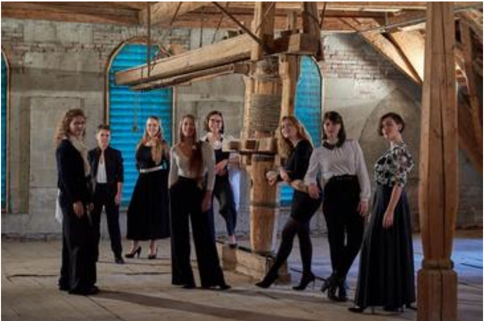
VoiceMix, Essen, 8 Mitwirkende