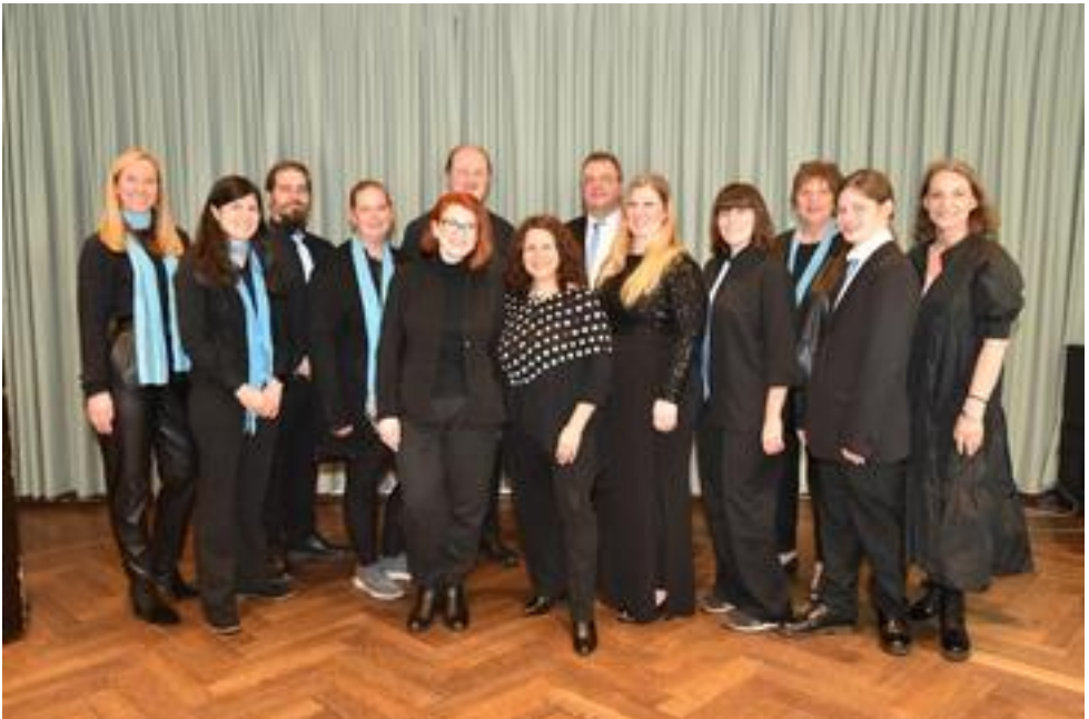
V.I.P. - Voices in peace, Köln, 15 Mitwirkende