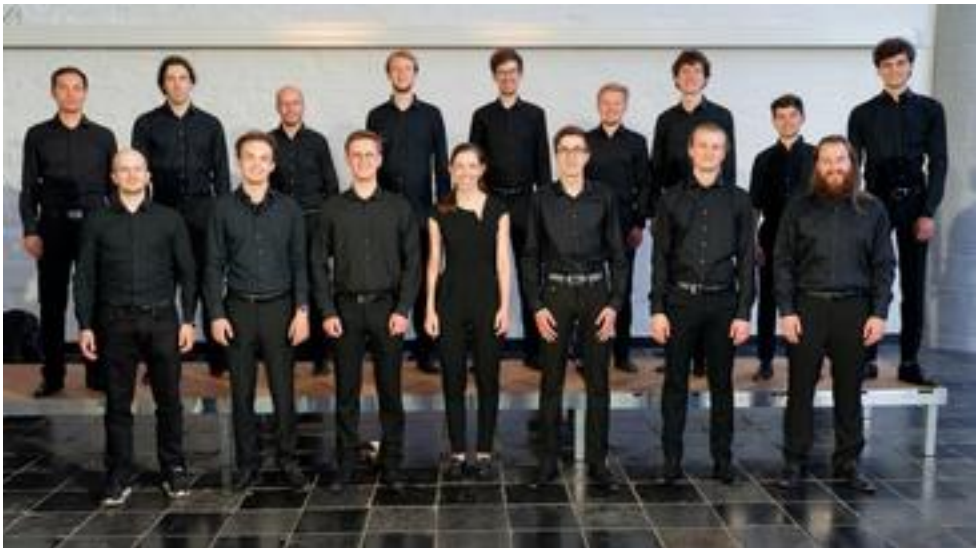
Männervokalensemble Aachen, 18 Mitwirkende