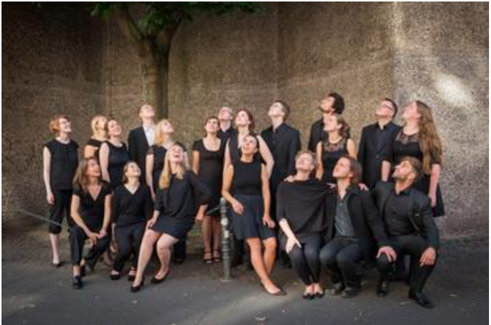
Junger Kammerchor Köln, 25 Mitwirkende