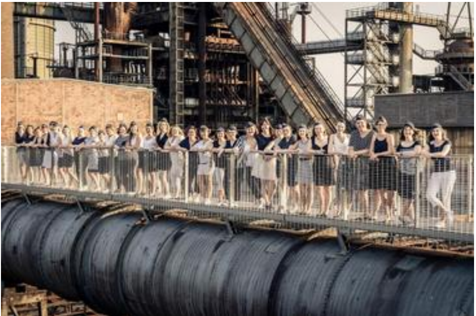
Vocal Crew, Dortmund, 23 Mitwirkende