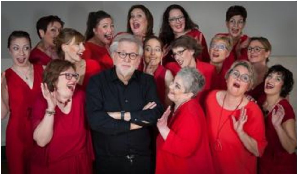
Ladies First, Dortmund, 34 Mitwirkende