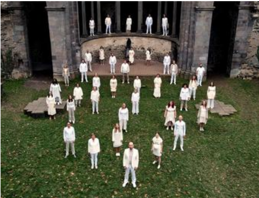
Bonner Jazzchor, 51 Mitwirkende