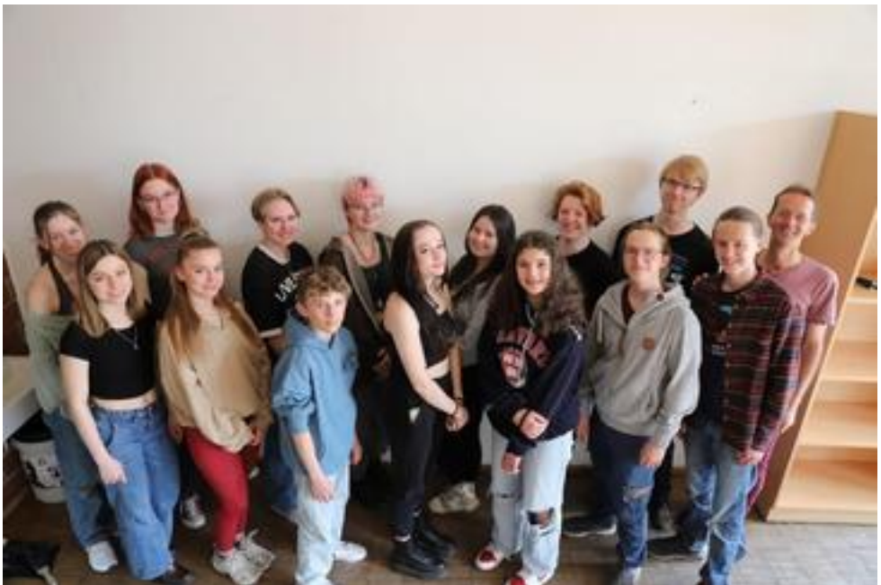
FALS-Voces Solingen, Solingen, 23 Mitwirkende