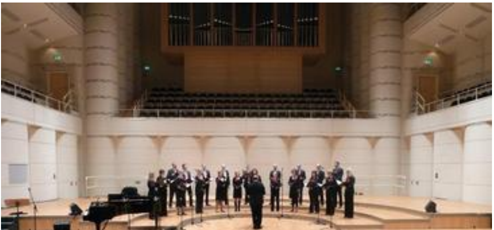
Ratinger Kammerchor e.V., Ratingen, 20 Mitwirkende