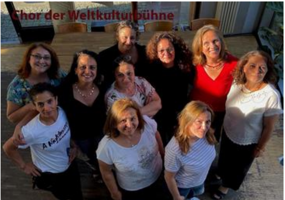
Chor der Weltkulturbühne e.V., Köln, 10 Mitwirkende