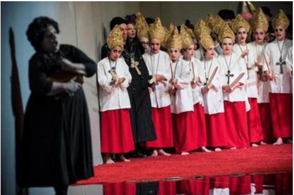
Aalto Kinderchor Essen, 36 Mitwirkende