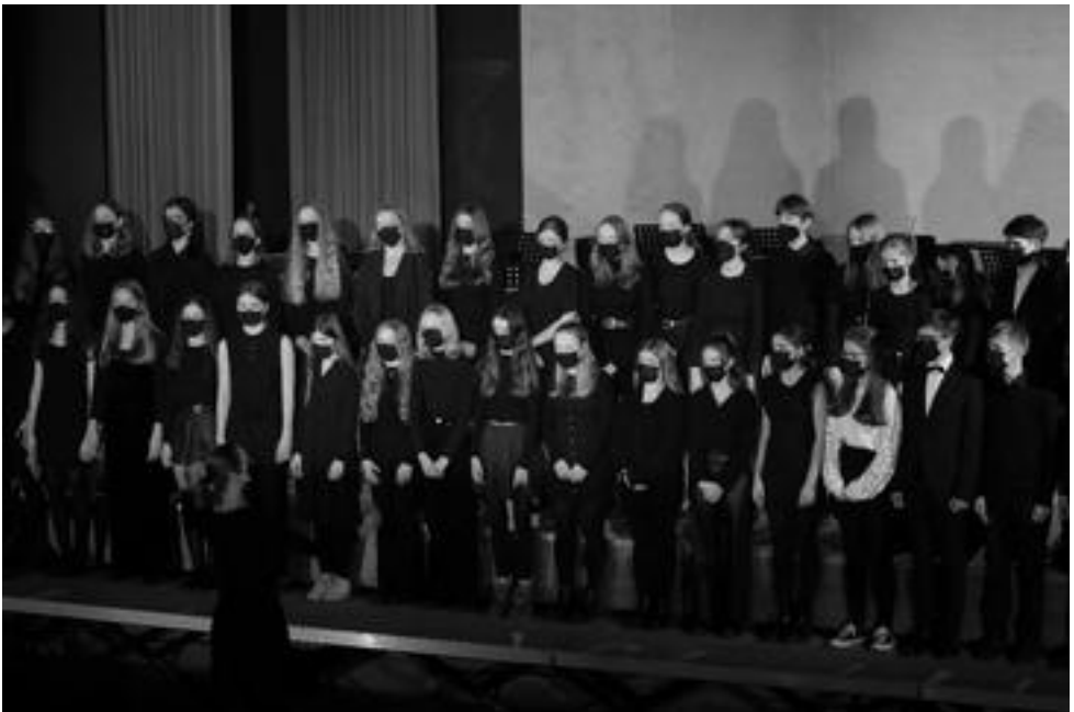
Chor 9-12 des Gymnasiums Essen-Werden, 45 Mitwirkende