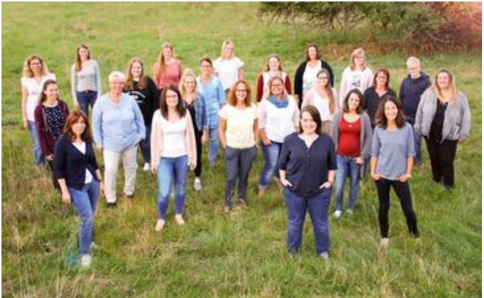
Frauenensemble Encantada, Burbach, 24 Mitwirkende