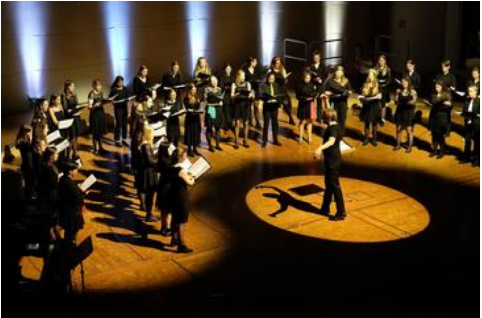
Jugendmädchenchor der Chorakademie am Konzerthaus Dortmund e.V., 41 Mitwirkende