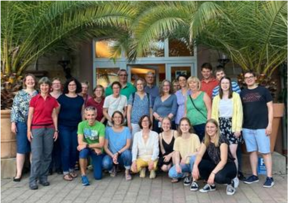
Kammerchor der Auferstehungskirche Essen, 29 Mitwirkende